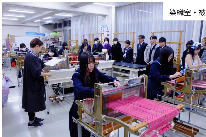
染織室・被服室での見学の様子

体験入学に参加してくれた皆さん、ありがとうございました。お手伝いしてくれた家庭クラブ役員の皆さん、協力・対応してくれた2・3年生の皆さん、お疲れ様でした。