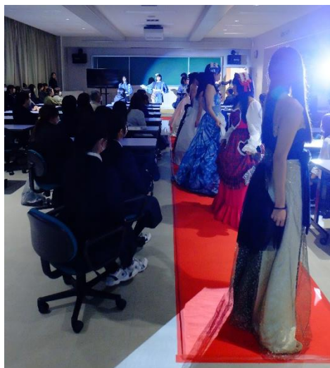
ミニファッションショーの様子